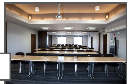
Hotel Olymp 3 ul. Kasprowicza 15, 78-100 Kołobrzeg