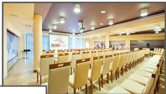
Ikar Plaza ul. Wschodnia 35, 78-100 Kołobrzeg