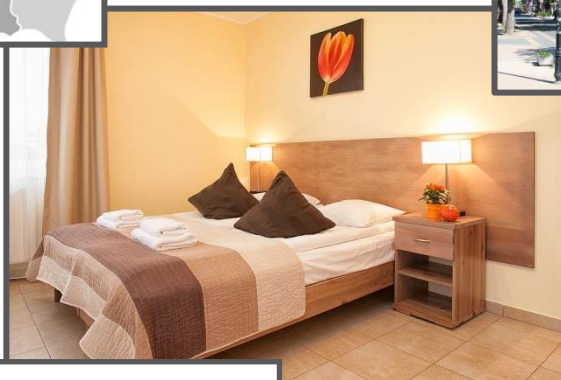
HOTEL PLANETA ul. Wojska Polskiego 4, 76-032 Mielno